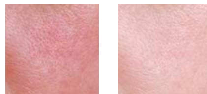
Bőrirritáció – a szérum használata előtt és után